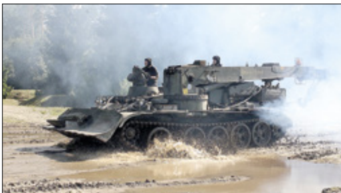
JVBT testissä lentokentällä.

Museon pajalle vastaanotettiin kesäkuussa Panssariprikaatista kokonaan uusi vaunutyyppi, JVBT-55A. Tämä vastikään museoitu tšekkoslovakialaisvalmisteinen, monikäyttöinen evakuointipanssarivaunu otettiin ilolla vastaan erityisesti työjuhduksi. Tappien raskasvaunujaosto sai tyyppiin heinäkuussa koulutuksen. Vaunulla suoritettiin jo muutama hinaus, mutta valitettavasti koeajon aikana siihen iski perustavanlaatuisen vika, jonka epäiltiin aikaisempien tapausten perusteella olevan välityspyörästössä. JVBT on hinattu pajalle. Vikaa ja tarvittavia korjaustoimenpiteitä selvitetään parhaillaan. Vaunun toivotaan saatavan pian kuntoon, sillä sen nosto- ja veto-ominaisuuksista todettiin olevan paljon hyötyä.