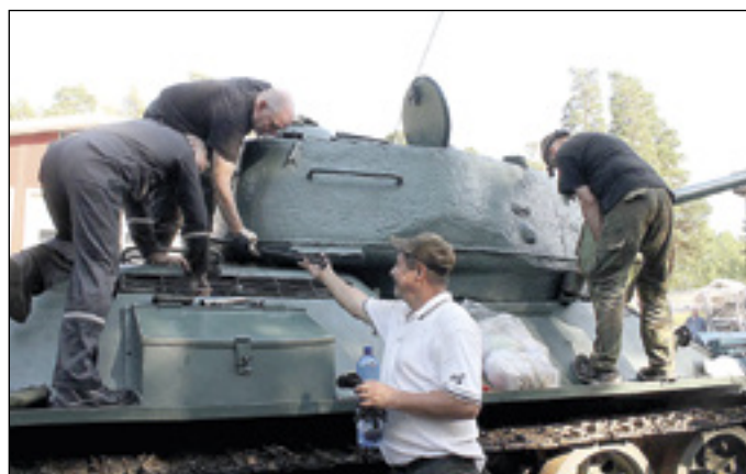
Sotkan Ps 245-4 perushuolto työn alla.

Keväällä ja kesällä pitämättä jääneet kewätsawutus ja perinteinen perhepäivä kokivat renessanssin elokuussa, ja niin myös niiden ajonäytökset. Tapahtumien järjestelyt aloitettiin pika-aikataululla, joten näyttöksiin piti valita nopeasti käyttöön saatavaa kalustoa. Perhepäivänä teemana olivat kotimaiset pyöräajoneuvot kolmen tyyppin voimalla.