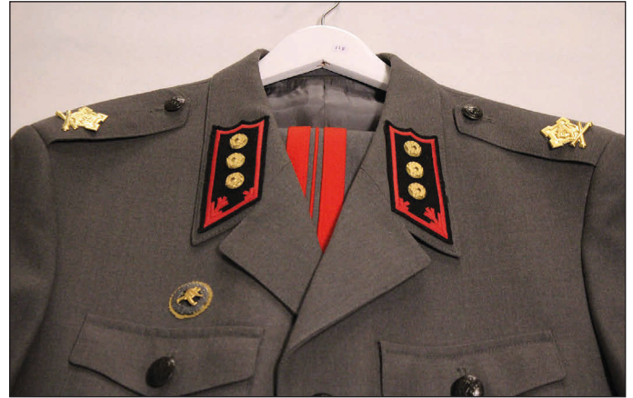
Rannikotykistön sotilaat käyttivät punaisia reväärejä housuissa vaikka kauluslaatat olivat mustat.

Rannikotykistö sai vanhat mustat laattansa takaisin vuonna 1984, mutta ilo jäi varsin lyhytaikaiseksi, koska rannikotykistö yhdistettiin Merivoimiin vuonna 1998. Silloin rannikotykistön väki ryhtyi käyttämään Merivoimien pukuja sekä sotilasarvoja.